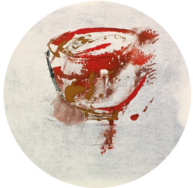
Monotype, Michèle Goëmon

Avec empathie naturelle et douceur, une grande écoute et ma connaissance de l'humain, je sais transmettre à chaque personne l'énergie appropriée pour voir sa joie grandir et son cœur sourire !